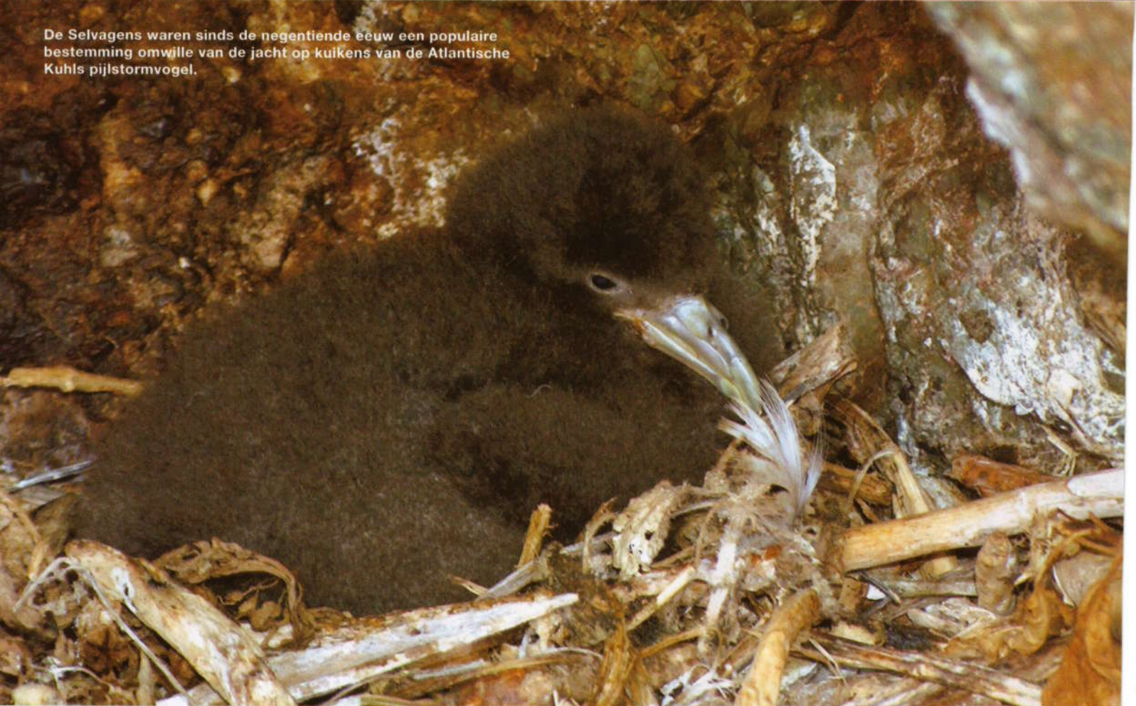
De Selvagens waren sinds de negentiende eeuw een populaire bestemming omwille van de jacht op kuikens van de Atlantische Kuhls pijlstormvogel.