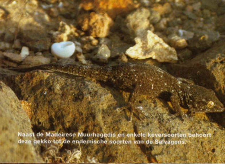
Naast de Madeirese Muurhagedis en enkele keversoorten behoort deze gekko tot de endemische soorten van de Selvagens.